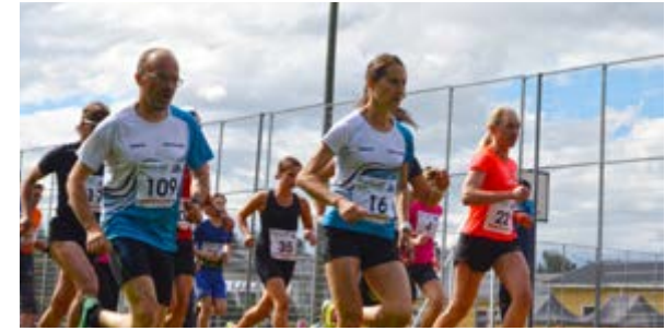
Konnevesi Cross Run 2018, kuva: Rositsa Bliznakova

Konnevesi CrossRun juostiin 30.6.2018 Lapunmäellä kolmannen kerran. Matkoina olivat edelleen 13 km ja 25 km kilpasarjassa, 13 km hölkkä- ja patikkasarjassa.