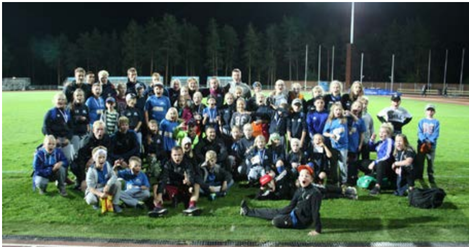
Juniorijalkapalloilijat tekivät kauden päätösreissun JJK:n kotipeliin 20.9.2018. Huipenuksena yhteiskuva Harjun nurmella, jossa mukana myös JJK:n pelaajia.