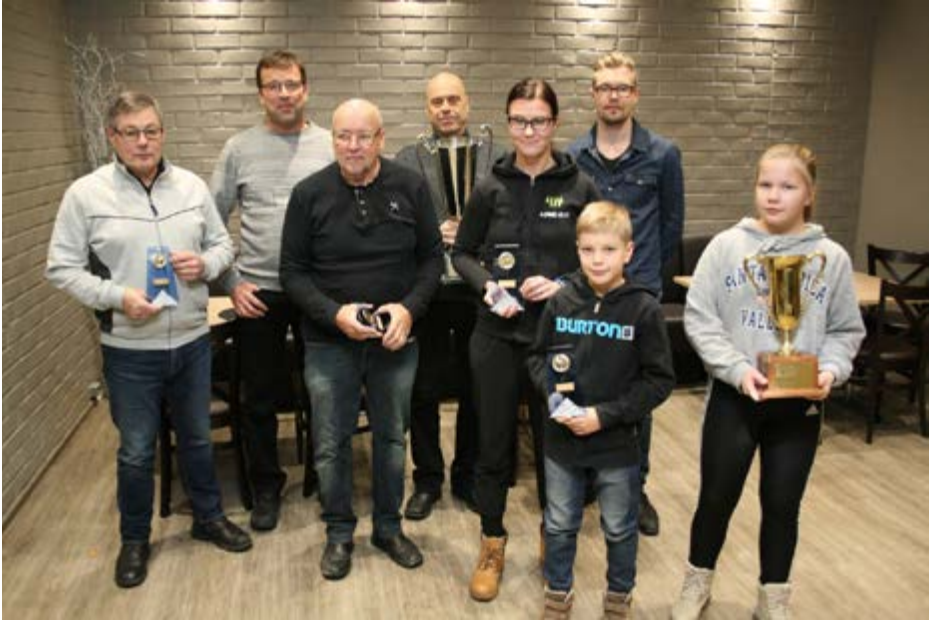
Vuoden 2018 palkitut, kuva: Juho Laitinen